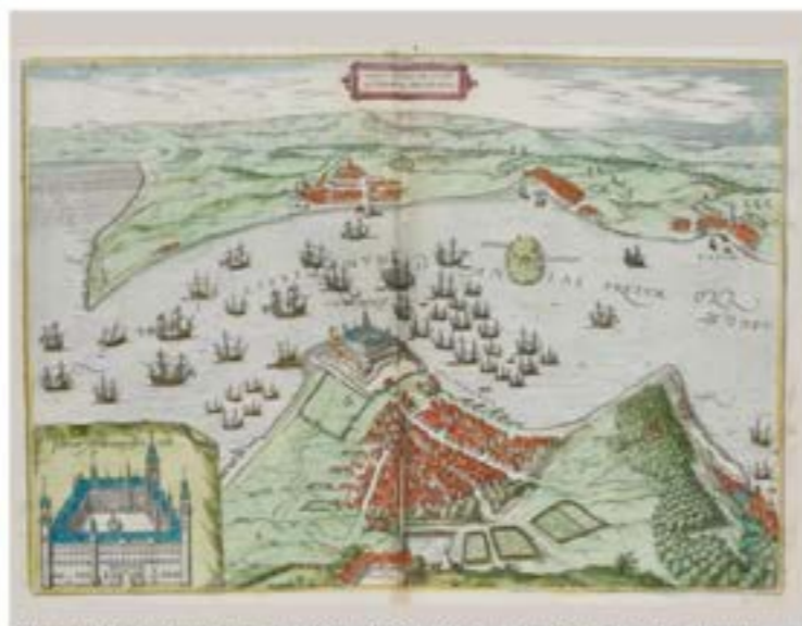
Helsingör och Helsingør nær de kontrollerte Öresundstullen år 1700. Georg Braun (1541–1624).

Mellan 1600 och 1800 upplevde Öresundsregionen en period av stor framgång och blev en central handelsknutpunkt i norra Europa. Denna period präglades av Danmarks kontroll över sundet och tullavgifter för sjöfarten, men också av Sveriges strävan efter inflytande.